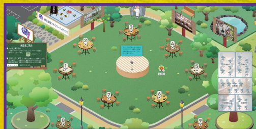
※メタバース会場のイメージ写真