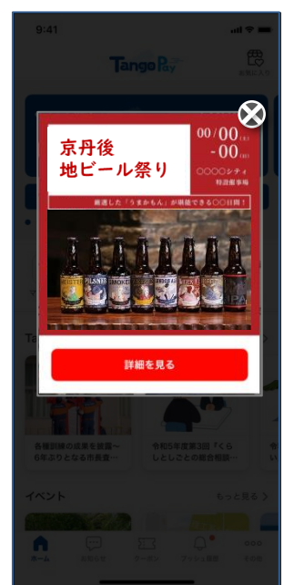
▲メッセージ表示画面